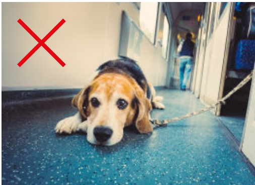
Im Zug hat Ihr Hund nichts auf dem Gang zu suchen.

Hunde, die nicht in einer Transportbox mitgenommen werden, müssen im Zug an der Leine geführt werden und einen Maulkorb tragen. Wird ein Hund ohne diese Utensilien angetroffen und können diese auf Aufforderung des Zugbegleiters nicht angelegt werden, kann er aus dem Zug verwiesen werden. Vom Maulkorbbzwang ausgenommen sind Blindenhunde und Begleithunde von Schwerbehinderten.